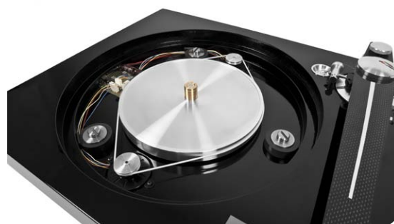
Zwei Motoren übertragen ihre Kraft per Rundriemen an den Subteller