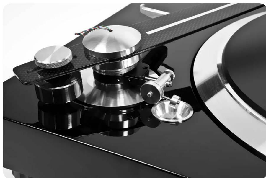
Die Kraft der klassisch mit Faden und Gewicht ausgeführten Antiskating-Mechanik ist einstellbar

gefügt werden. Dieses Kunsthandwerk symbolisiert in der japanischen Kultur noch heute die Fähigkeit, Objekte von echtem, dauerhaftem Wert zu schaffen – was könnte passender sein.